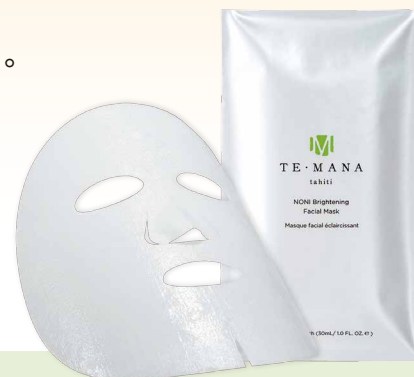
テマナノニブライティング フェイシャルマスク (シート状美容液マスク)