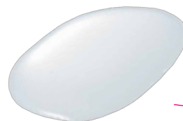
たっぷりの美容成分で ひたひたシートマスク

目の周りにはアイクリーム、口の周りにはナイトクリームを塗ることで乾燥を防ぎます。