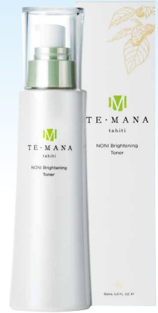
テマナ ノニブライティング トナー（化粧水）